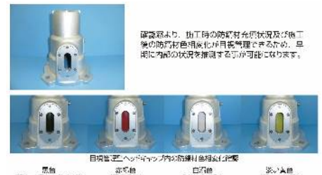
防錆油の変色確認例